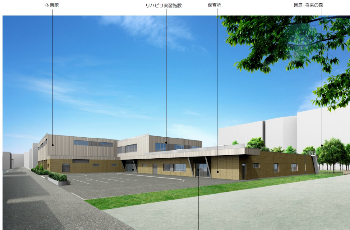
西 19 丁目街区イメージパース