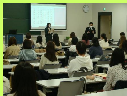
新入生オリエンテーション