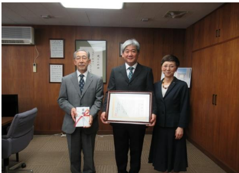
塚本学長、館保健医療学部同窓会長、大日向保健医療学部長

感謝状贈呈式後、新型コロナウイルス感染拡大防止対策の中での教育に関する課題などの意見交換を行いました。