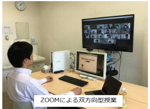
ZOOMによる双方向型授業

一方、Moodleは、学生が教材にアクセスして学習する、e-ラーニングの形態を持つオンライン教育システムです。