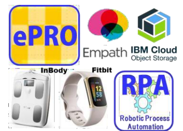
図 1. デジタル健康管理

これまでの医療・ケアに人の QOL 価値や費用価値を付加する目的で研究を進めてきました。また、研究には患者さんの多大なご協力や医療者の労力がかかりますが、これらにかかるデータ入力やデータ解析までを自動化して負担の無い、未来の研究を目指しています。骨格となる ePRO はオリジナル開発したもので、これに Fitbit, InBody, Empath などと既製品と接続することで開発費の抑制と開発期間を短縮しています。データもクラウドサービスを活用することで、解析の自動化が可能です。