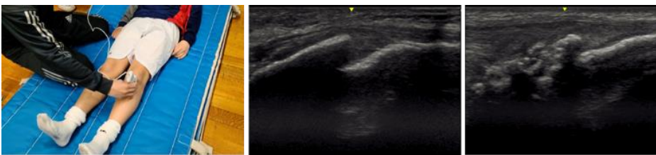
左図 : スポーツ現場での超音波健診 中央図 : 正常の脛骨粗面 右図 : 異常所見

これらの基礎研究に加え、スポーツ現場においては超音波を活用した研究にも取り組んでいます。超音波は侵襲を伴わない診断機器であり、これによりスポーツ傷害の早期発見と予防につなげています。