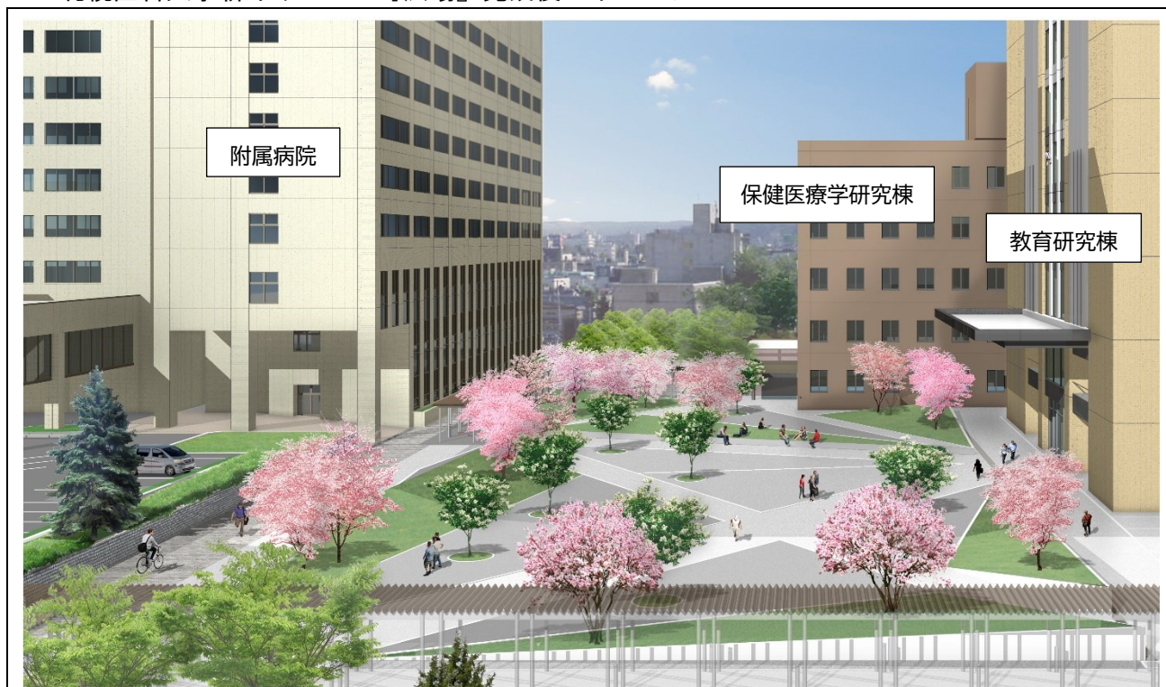
春のイメージパース（南1条側からみた広場）

芽吹き、新緑、紅葉と季節感が非常に豊かな特性を持つ落葉広葉樹（ライラックに似た白色の花を咲かせる「ハシドイ」、濃い桃色の花が優美な北海道の代表的な桜「エゾヤマザクラ」）の中木を植栽。