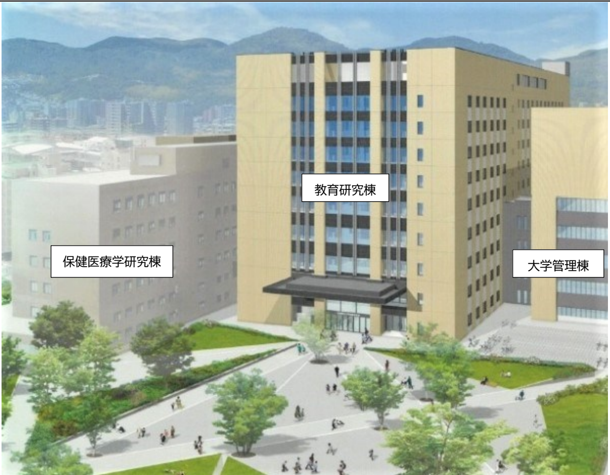
イメージパース（附属病院側上空からみた広場）