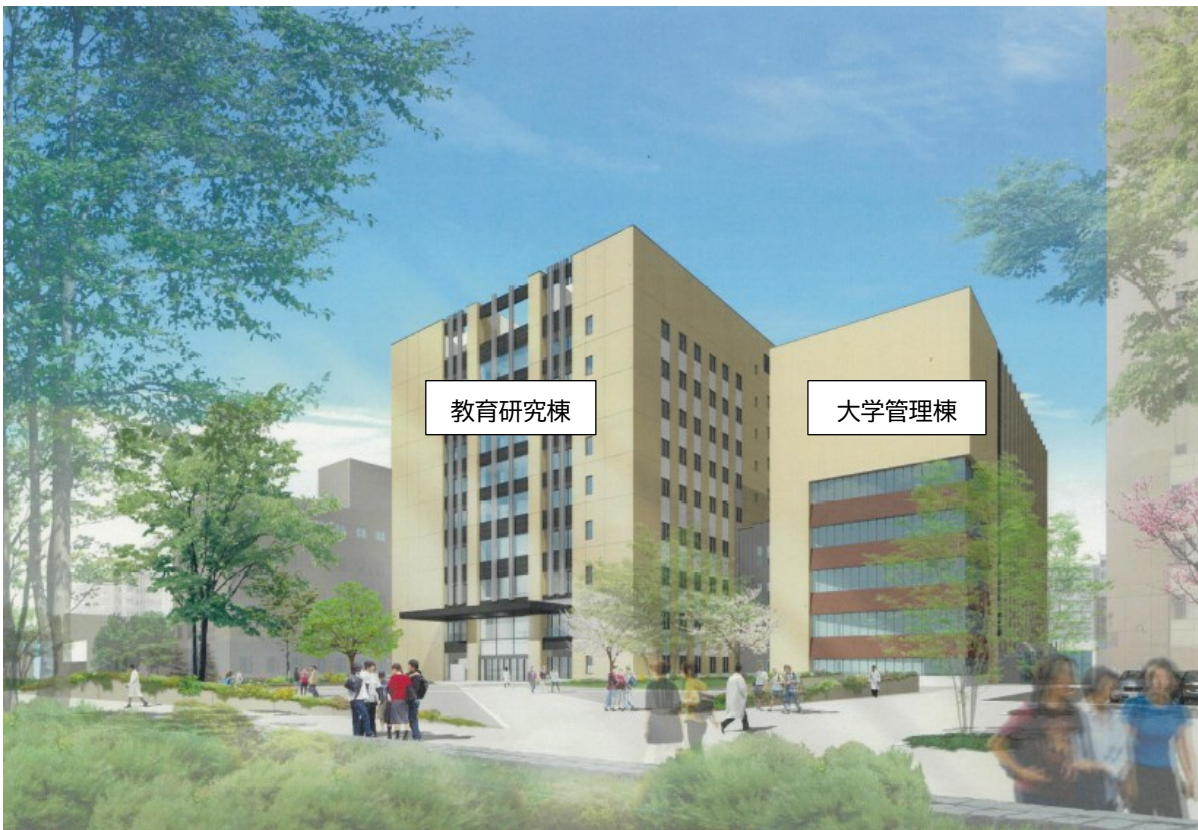
イメージパース（附属病院側地上からみた広場）