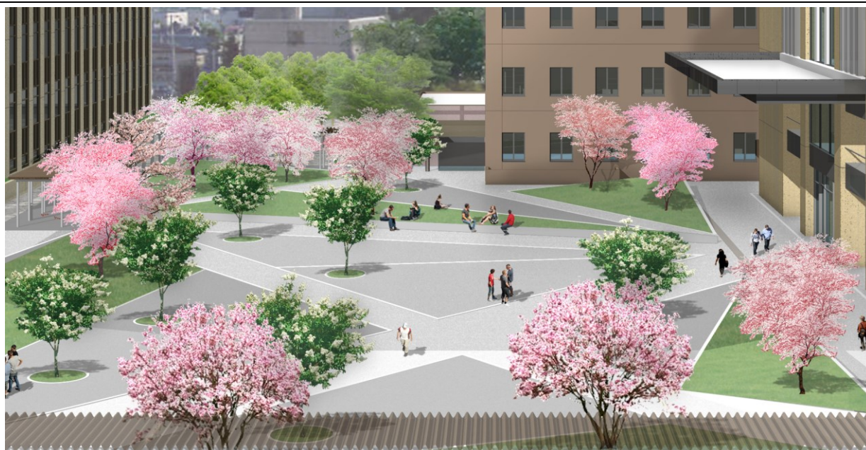
春のイメージパース（南1条側からみた広場）一部拡大

芽吹き、新緑、紅葉と季節感が非常に豊かな特性を持つ落葉広葉樹（ライラックに似た白色の花を咲かせる「ハシドイ」、濃い桃色の花が優美な北海道の代表的な桜「エゾヤマザクラ」）の中木を植栽。