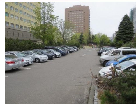
第1駐車場 (東) 患者用 64台(R4~45台程度に減少)