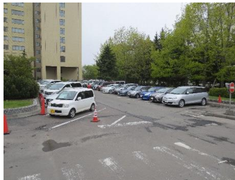
第1駐車場 (西) 患者用 44台(うち障がい者用10台)