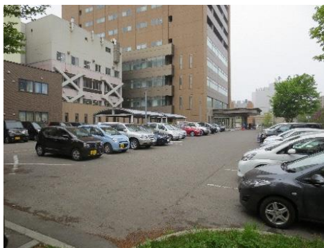
第2駐車場 (東) 解体工事に伴い休止中