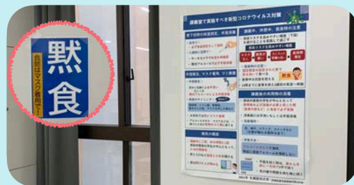
講義室に感染対策ポスターを掲示