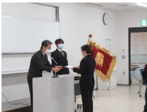
4月1日の辞令交付式です。昨年度と同じく、代表者1名による辞令交付でした。