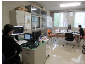
5月に開催されたフィジカルアセスメント I-②はオンライン研修でした。グループセッションをまえながら、オンライン上でも積極的に学ぶ様子が窺えました。