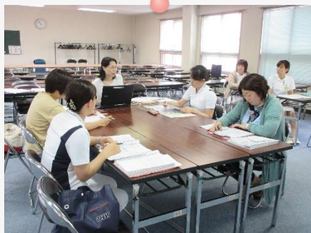
院内認定エキスパートナース養成コース 「せん愛ケアコース」がスタートしています！