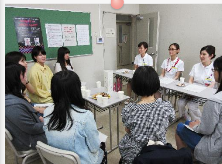
「看護学科4年次学生と先輩看護職との交流会」 卒業後のキャリア形成のイメージ化を図ります