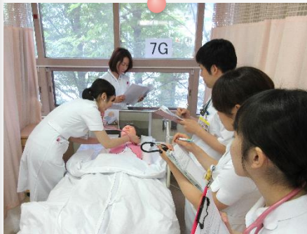
新人看護職員研修「フィジカルアセスメントI」 この肺音はどんな兆候を示しているのかな…？