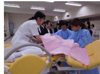
〔分娩介助演習の体験〕