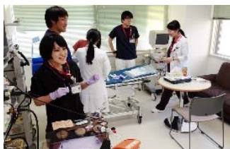
24時間利用可能なトレーニングルーム