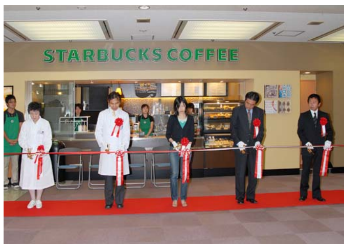
(テープカット風景)