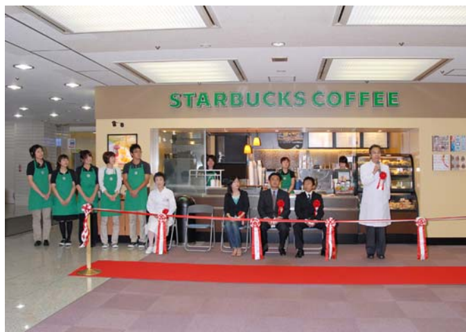
(スターバックスコーヒー札幌医科大学附属病院店全景)